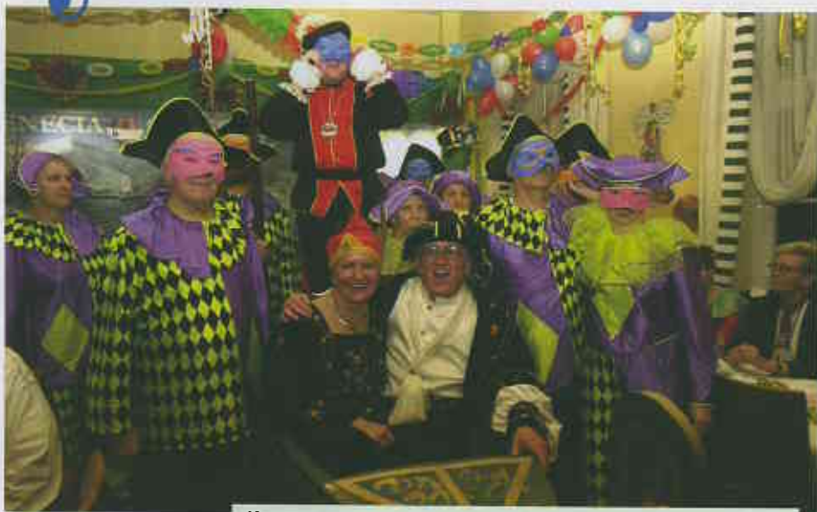
Kostüm und Maskenball á la Venezia (s. Bericht Seite 7)