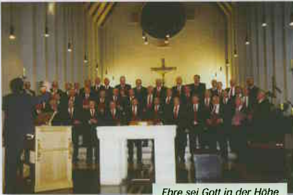
Ehre sei Gott in der Höhe

Zum ersten Mal in der Vereinsgeschichte der Concordia hatte sich zu einer Chorprobe der WDR mit einem Kamerateam eingefunden. Gesendet werden sollte in der „Aktuellen Stunde“ unter Tipps & Termine die Ankündigung des Weihnachtskonzertes am 16.12.2001 in der St. Josefskirche.